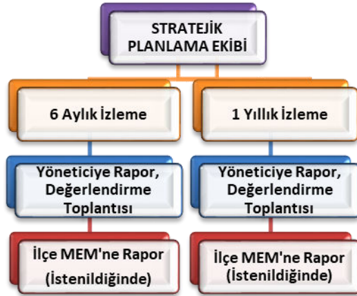
Şekil 8 Stratejik Plan İzleme ve Değerlendirme Modeli

Müdürlüğümüzün 2024-2028 Stratejik Planı İzleme ve Değerlendirme sürecini ifade eden İzleme ve Değerlendirme Modeli hazırlanmıştır. Kurumumuzun Stratejik Plan İzleme-Değerlendirme çalışmaları eğitim-öğretim yılı çalışma takvimi de dikkate alınarak 6 aylık ve 1 yıllık sürelerde gerçekleştirilecektir. 6 aylık sürelerde Kurum Müdürüne rapor hazırlanacak ve değerlendirme toplantısı düzenlenecektir. İzleme-değerlendirme raporu, istenildiğinde İlçe Milli Eğitim Müdürlüğüne gönderilecektir.